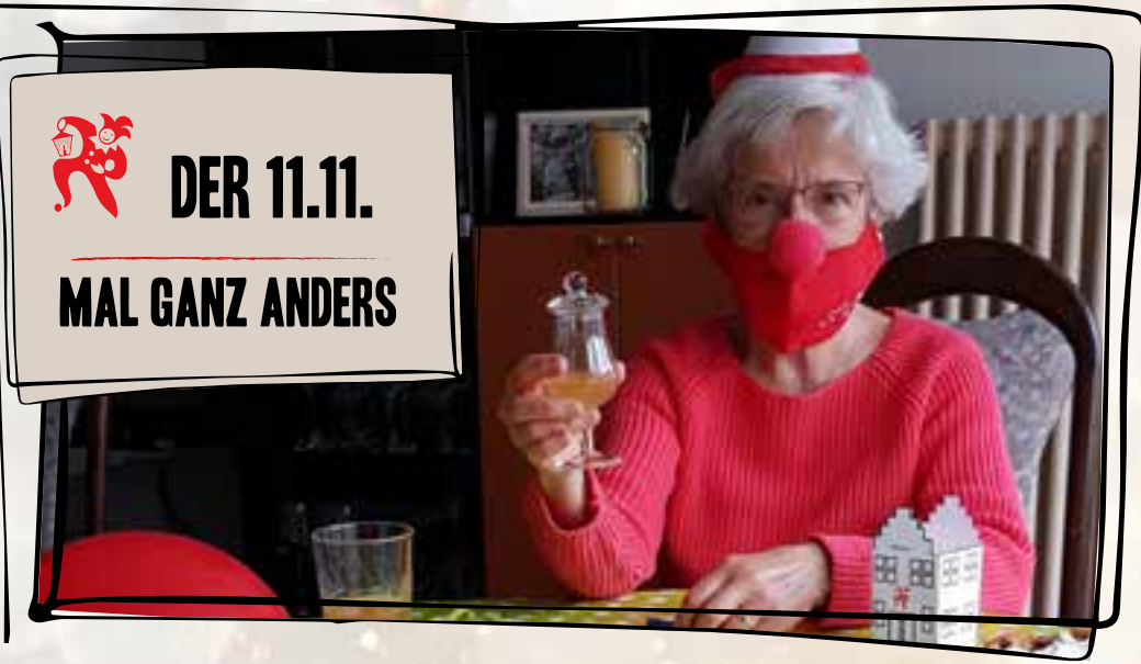
Mit dem Survival-Kit zu Coronazeiten den 11.11. zu Hause feiern.