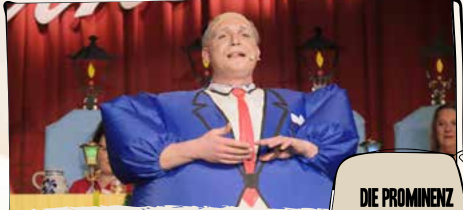
Reiner Calmund alias Maximilien Dieter