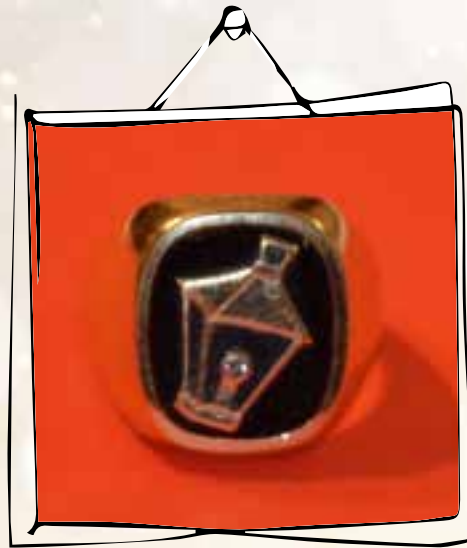
Ehrenringe des Laterne