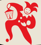
Stimmung auf der Bühne...